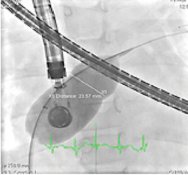
Şekil 2. TTE ile subkostal pencereden kapama cihazının bırakıldıktan sonraki görünümü.